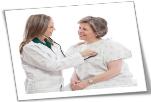
Monitorización de la seguridad