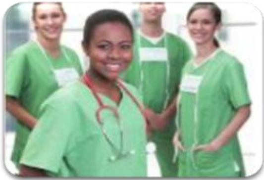
Procesos de gestión de eventos adversos e incidentes