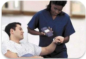
Identificación de los Usuarios