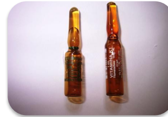
Seguridad en el Uso de Medicamentos