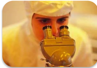
Ayudas Diagnósticas Críticas