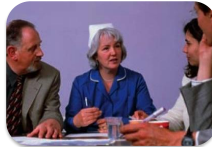
Operación de los Comités y Otros Grupos de Trabajo