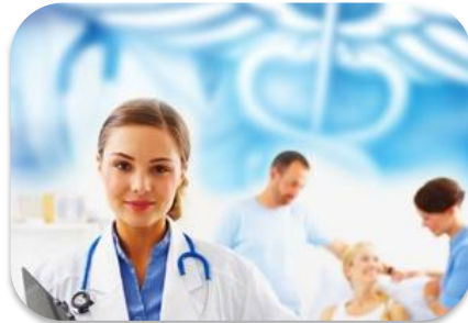
Modelo de Atención y Seguridad del Paciente