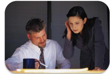
Gestión del talento Humano para la Seguridad del Paciente