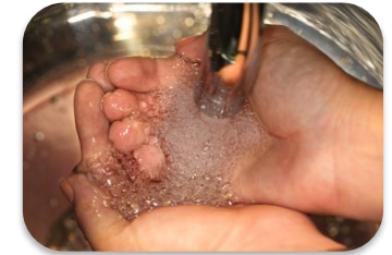
Prevención, Detección y Control de las IACS