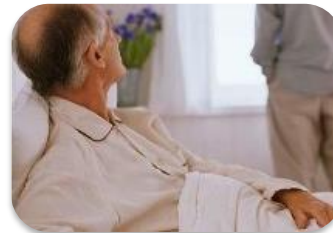
Participación del Paciente y su familia en la seguridad