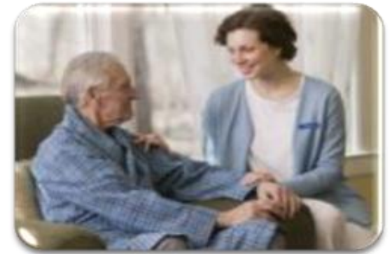
Gestión de riesgos y necesidades