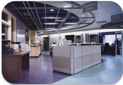
Alineación entre el direccionamiento estratégico y la seguridad